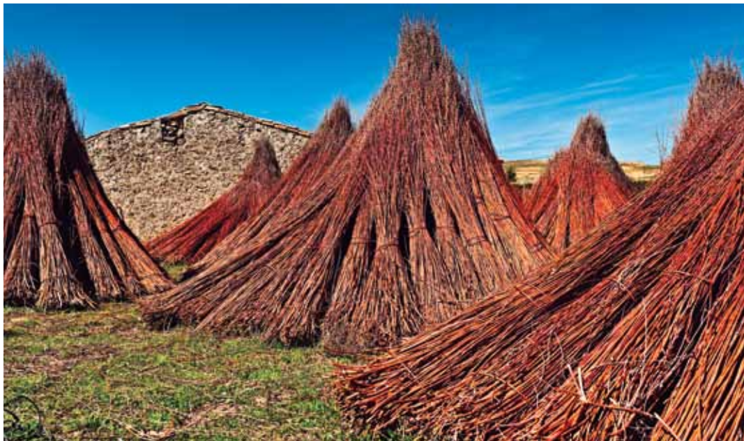
Haces de mimbre de los valles de la Alcarria y Sierra de Cuenca Cuenca Castilla - La Mancha

Deviate towards Mota del Cuervo and make out its seven mills on top of the hill, then head towards the picturesque mountain village, Tragacete, near the source of the of rivers Cuervo, Tajo and Júcar. Because of its untamed landscape it is a paradise for nature lovers.