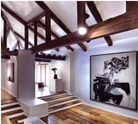
Arriba: Museo de Arte Abstracto Español. · Fiesta de " La Endiablada". Almonacid del Marquesado Cuenca | Castilla - La Mancha