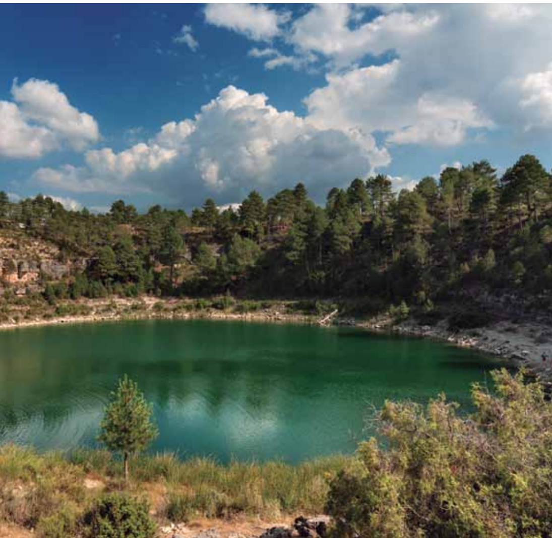
Laguna de Cañada del Hoyo Cuenca | Castilla - La Mancha