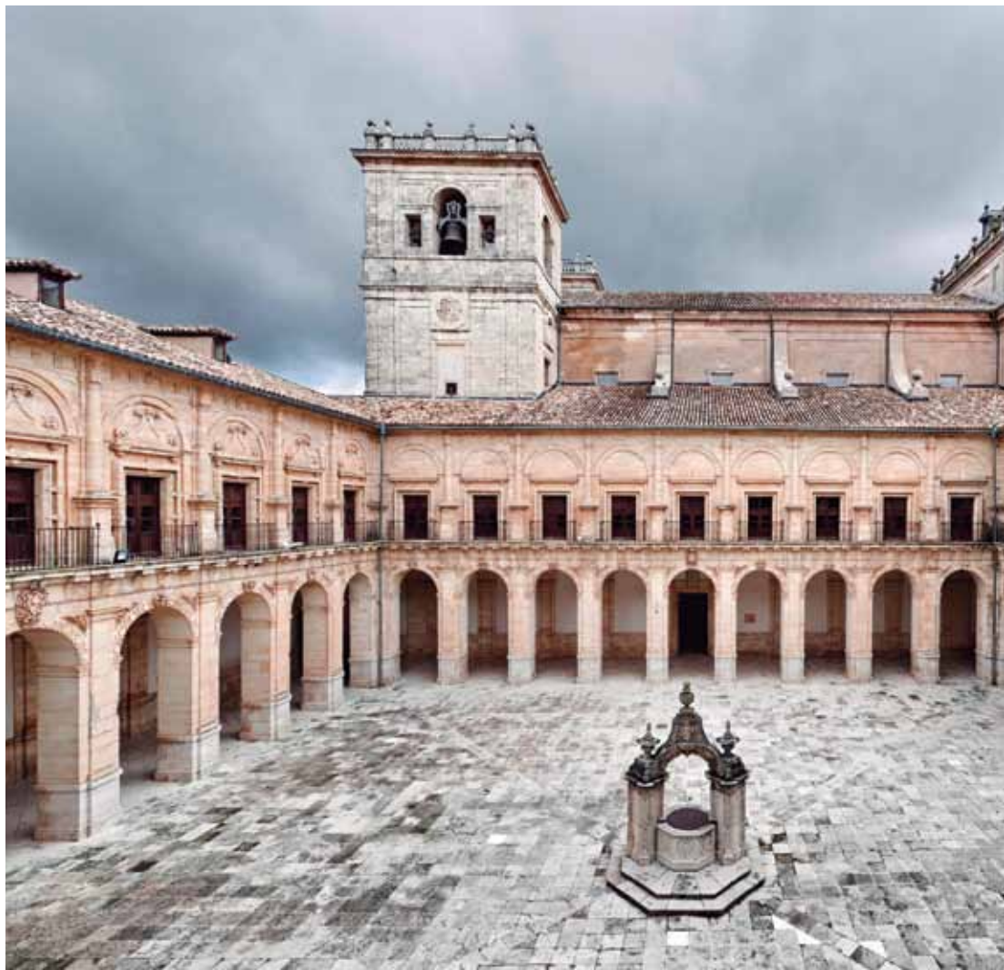
Claustro del Monasterio de Uclés | Cuenca | Castilla - La Mancha