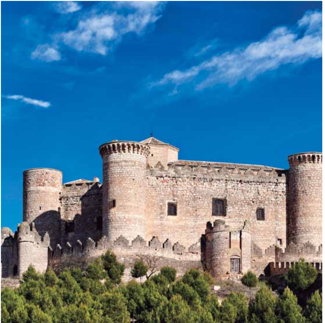
Castillo de Belmonte | Cuenca | Castilla - La Mancha