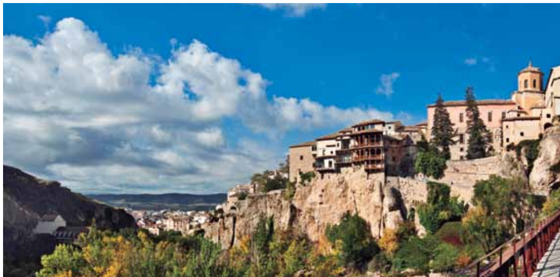
A. Celador Fernández >Fotografía portada: Casas Colgadas / Vista panorámica. Ciudad Patrimonio de la Humanidad Cuenca | Castilla - La Mancha

Te fascinarán sus Monumentos Naturales, como la Hoz de Beteta y Sumidero de Mata Asnos, sus inmensos espacios vírgenes como los Parques Naturales del Alto Tajo y la Serranía de Cuenca, sus bosques, sus cortados, sus aguas purísimas. Un lujo natural para practicar barranquismo, piragüismo, descenso de cañones, exploración de grutas y buceo. Y si te gusta la caza sostenible, compatible con la naturaleza, encontrarás variedad de especies, como el ciervo, la cabra montés, el jabalí y el corzo.